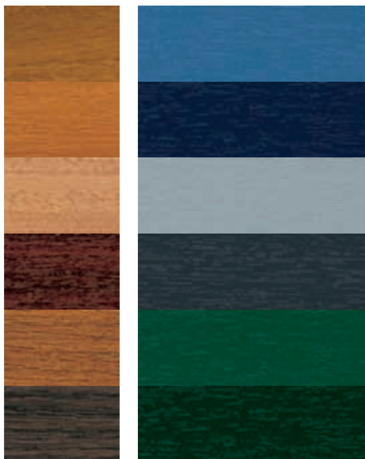
Om druktechnische redenen kunnen kleurverschillen mogelijk zijn

Ook de prestaties op het gebied van inbraakwering, statische eisen en wind- en waterdichtheid liggen met Schüco-systemen op het allerhoogste niveau.